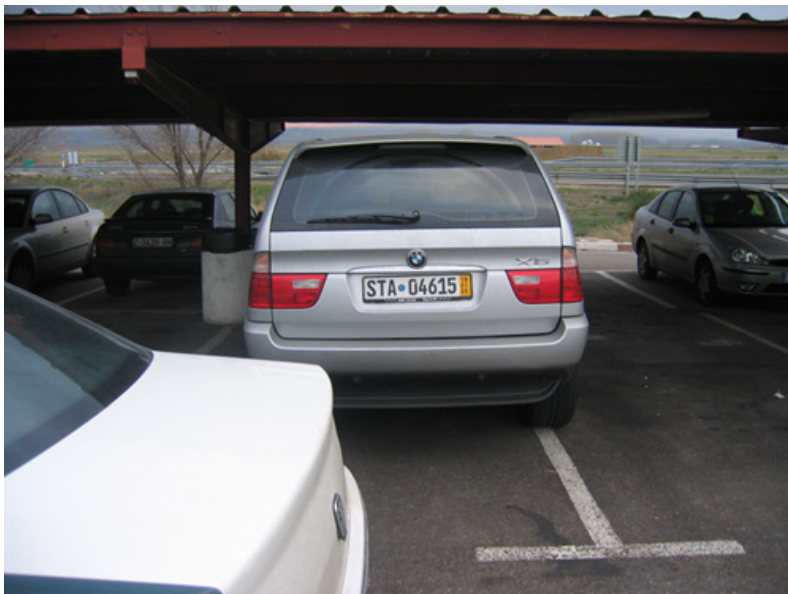
Vehículo intervenido sustraído en Alemania. (ZV)

Me dirijo de nuevo a ustedes con el fin de aclarar ciertas dudas que se han ido planteando a lo largo de los últimos meses en relación a la intervención con vehículos extranjeros amparados por placas alemanas temporales (de banda amarilla) denominadas KURZZEITKENNZEICHEN , aunque la duda sería extendida a todas aquellas placas de matrícula de profesionales de compra-venta extranjeras (francesas que tienen la letra W, las belgas de las serie de letras ZAB, las alemanas que empiezan por los dígitos 06, etc.)