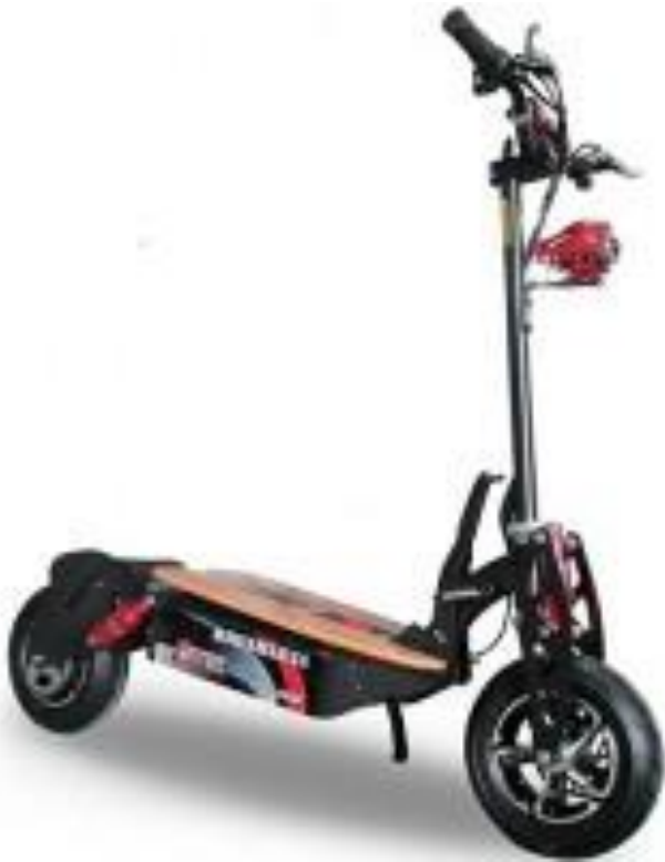
Patinete eléctrico (B)

Vehículos tipo B: los que tentan una velocidad máxima de 30 km/h y una masa hasta 50 kilos, como 'segways' y patinetes eléctricos grandes