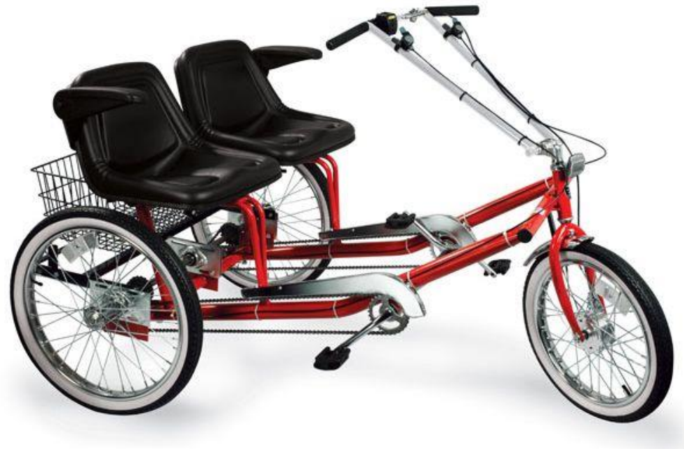
Ciclo de uso personal (C0)

Vehículos de tipo C: La categoría C se reserva a ciclos de más de dos ruedas que alcancen como máximo 45 kilómetros por hora y los 300 kilos de peso, que luego se subdividen en tres: C0 para uso personal; C1 para transporte turístico de pasajeros, y C2 para mercancías.