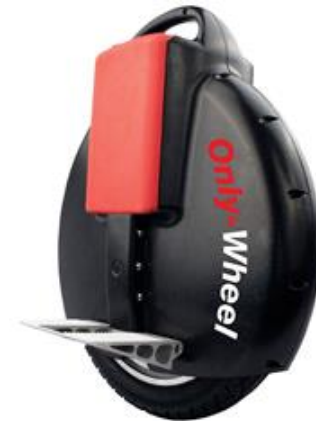
Monociclo eléctrico (A)