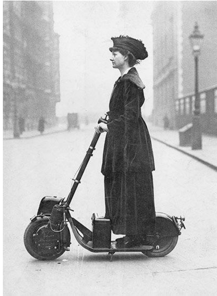
Lady Florence Norman, una sufragista inglesa, en su patinete a motor en 1916.

La DGT mediante la Instrucción 16/V – 124 de 03 de noviembre de 2016 reguló por primera vez, aunque de forma muy somera, los vehículos de movilidad personal. Estos vehículos tienen una historia muy antigua como se ve en la foto.