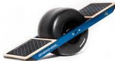
One Wheel (A)