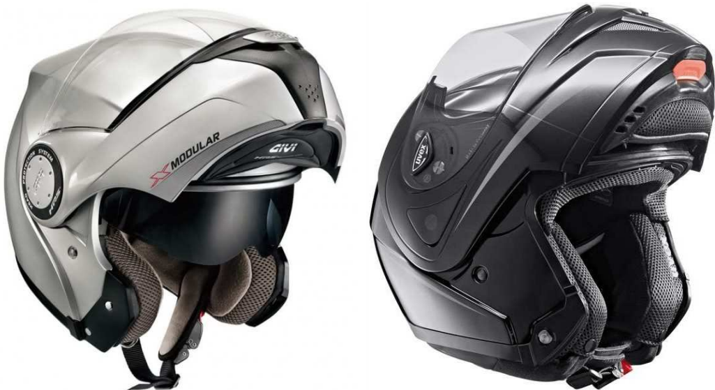
Cascos homologados como integrales o modulares (P) ó (P/J) con la “ mentonera o babera ” levantada