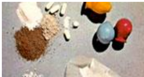
FORMAS DE PRESENTARSE LA HEROINA