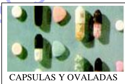
CAPSULAS Y OVALADAS