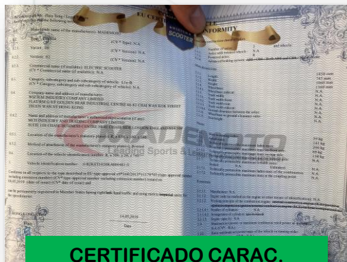
CERTIFICADO CARAC. TÉCNICAS